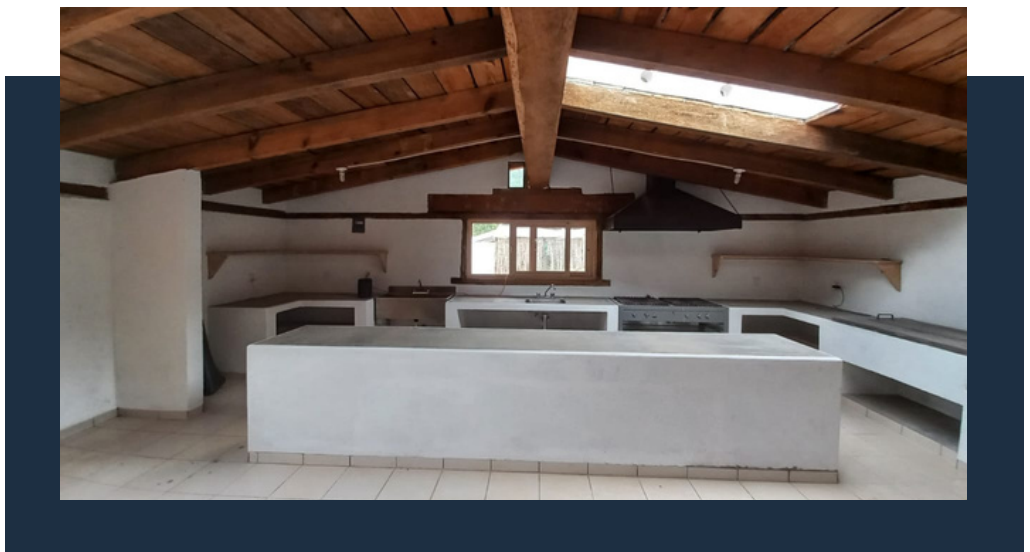
Cocina-comedor, Primaria La Huerta, después.