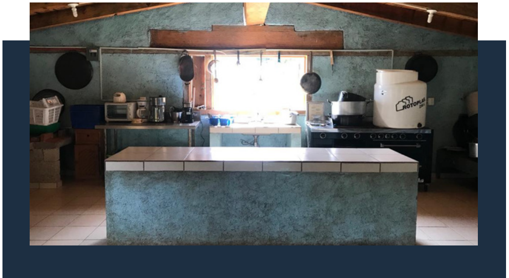
Cocina-comedor, Primaria La Huerta, antes.