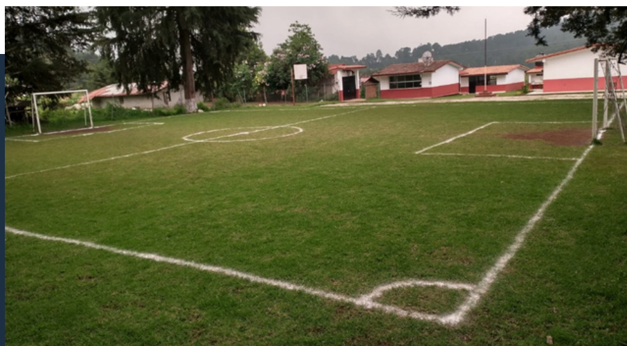
Cancha de fútbol, Primaria Mesa Rica.