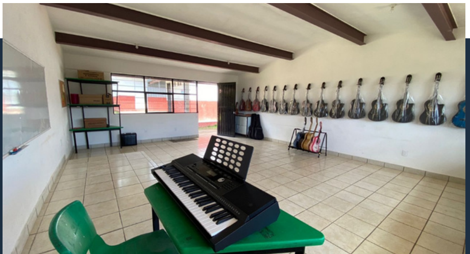
Salón de música, Primaria Mesa Rica, después.

Contar con espacios, instalaciones, equipos, utensilios y servicios funcionales, higiénicos y dignos para la óptima ejecución de los programas de Nutrición y Música de Fundación Valle la Paz en un marco de respeto, aprovechamiento y protección del medio ambiente.