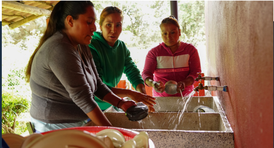
Madres de familia y cocineras de la Primaria El Manzano.