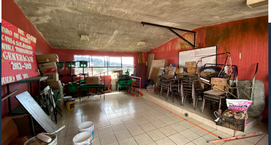
Salón de música, Primaria Mesa Rica, antes.